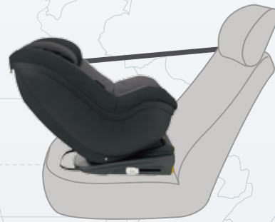
STEP 2 トップテザー・ストラップを装着