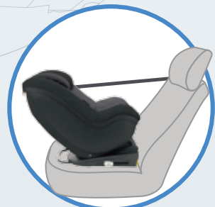
乳児モード 新生児～18ヶ月頃 2.5-13kg