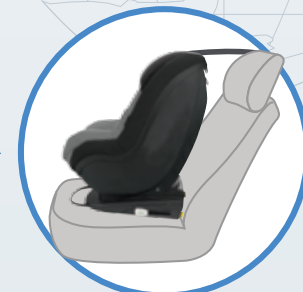
幼児モード 1歳頃～4歳頃 9-18kg